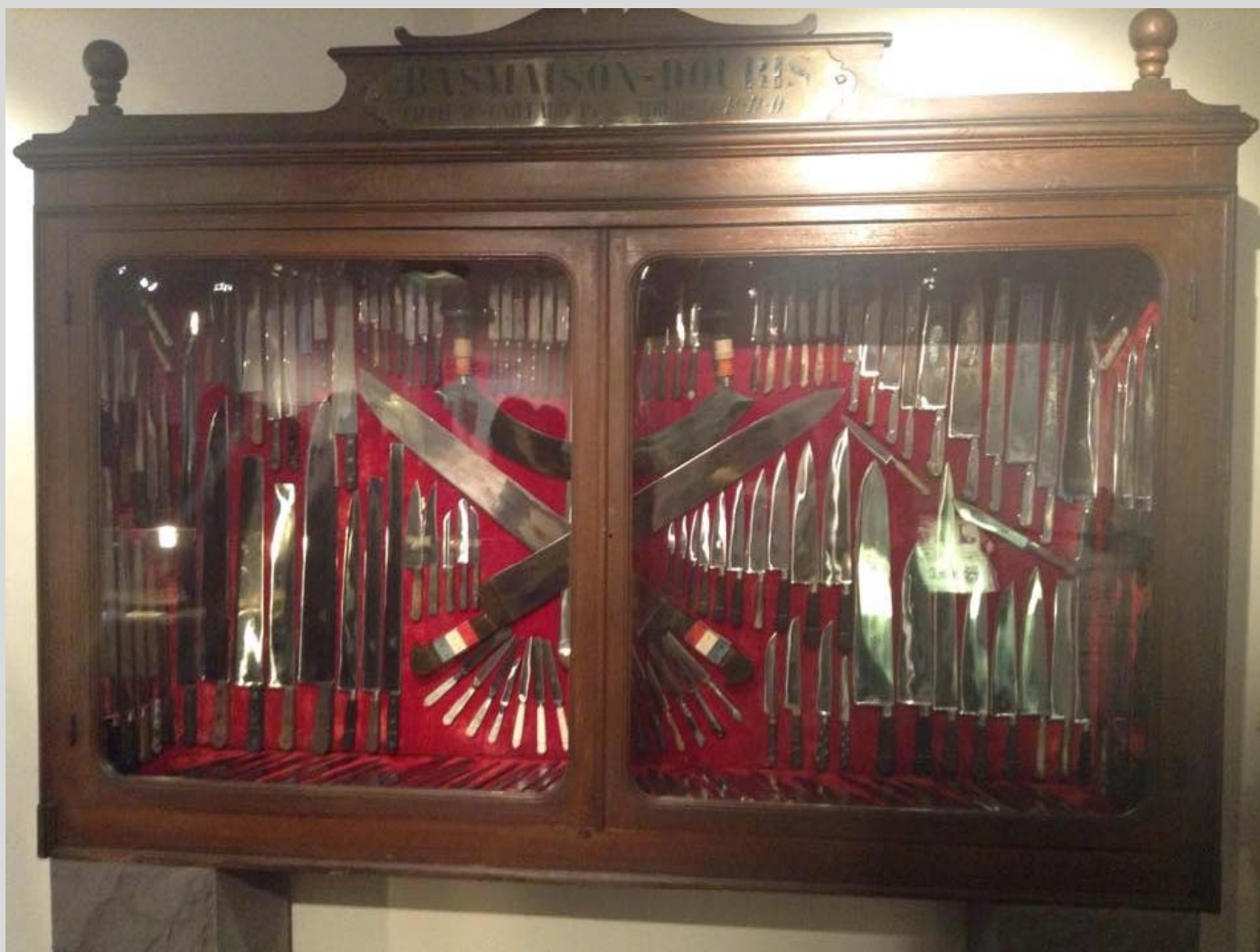
Une grande armoire à couteaux.